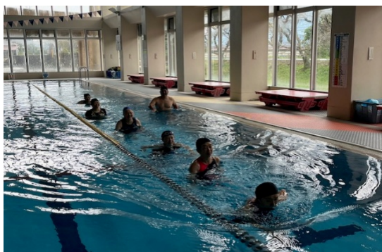
水中ウォーキング