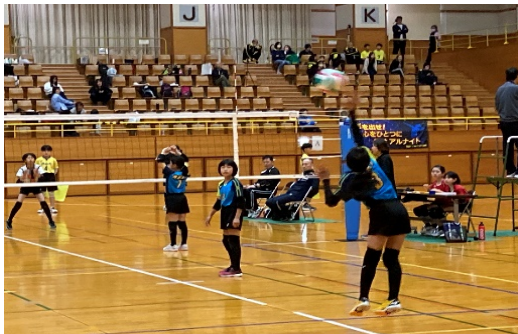
しらうめカップ落合招待バレーボール大会