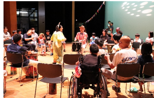
たたいて遊ぼうドラムサークル