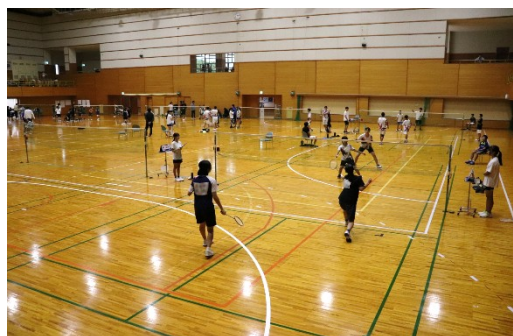
しらうめ小中学生バドミントン大会