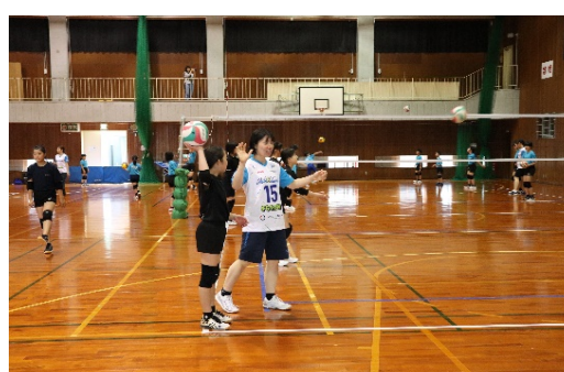
岡山シーガルズバレーボール教室 (トップアスリート)